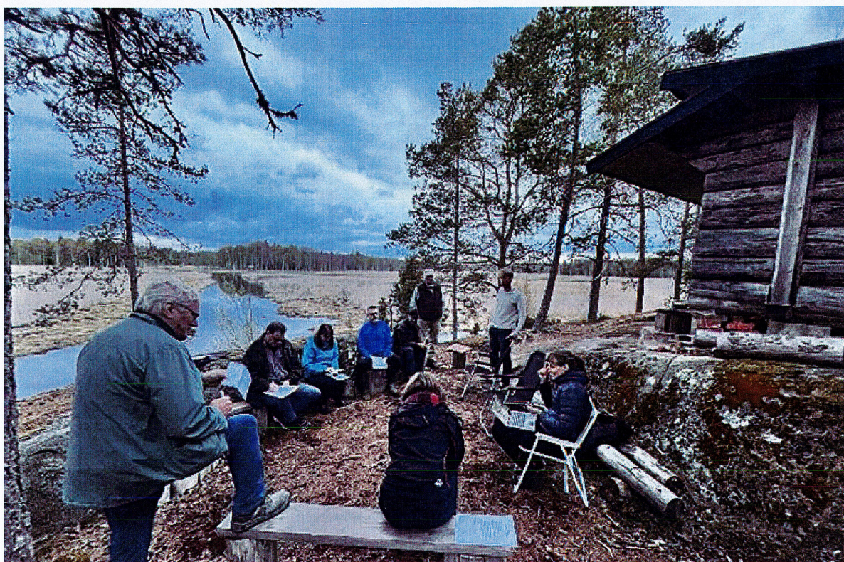
Årets mest natursköna styrelsemöte hölls i maj.