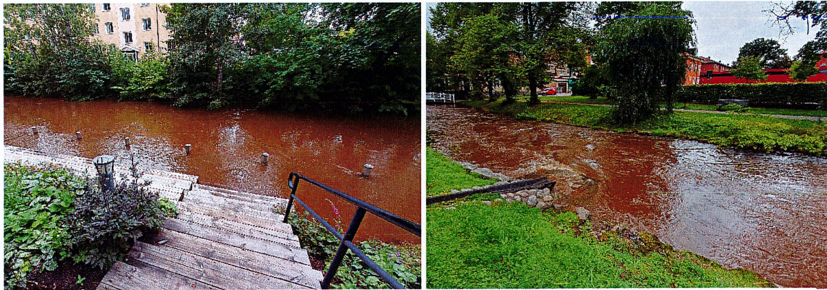
Lillån dagen efter skyfallet i början av september. Fotot till höger är taget vid Aguéliparken, där elfisket planerades att hållas.

Enligt arbetsplanen skulle en studieresa anordnas av styrelsen. Någon studieresa har dock inte blivit av under året men kvarstår som aktivitet i arbetsplanen för 2024. Enköpingsåns vattenråd har uttryckt intresse av att besöka oss för att ta del av arbetssätt och erfarenheter. Ett sådant besök har inte ägt rum men kan förhoppningsvis ske under 2024.