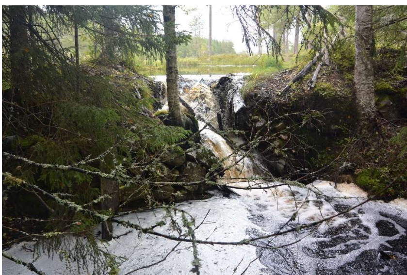
Figur 4 Dammen i Kvarntjärnarnas utlopp