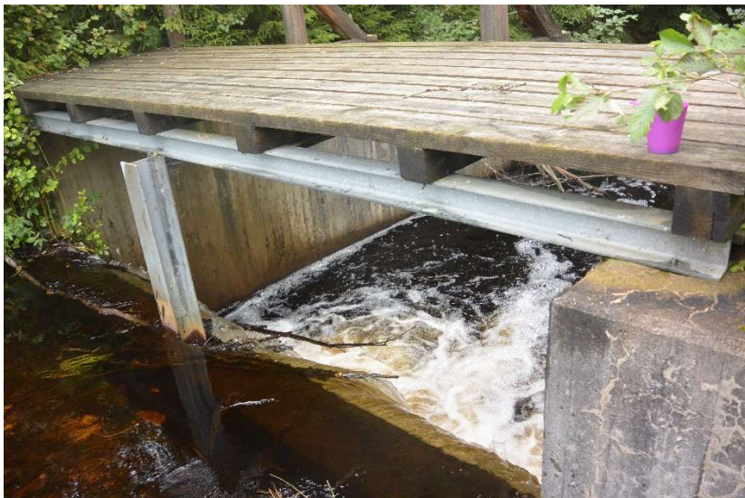
Figur 3 Dammen i Vallsjöns utlopp