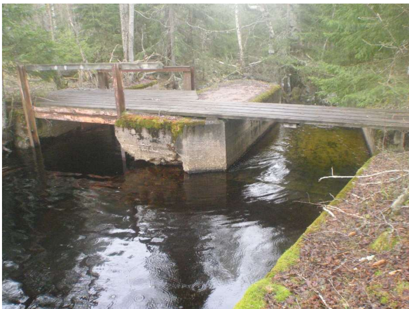
Figur 2. Bild på Skildammen (överst i Sandån)

Dialog med dammägare har påbörjats. Åtgärder pågår/planeras vid närliggande dammar. Avsänkning av dammarna bör genomföras för planering av fortsatta åtgärder.