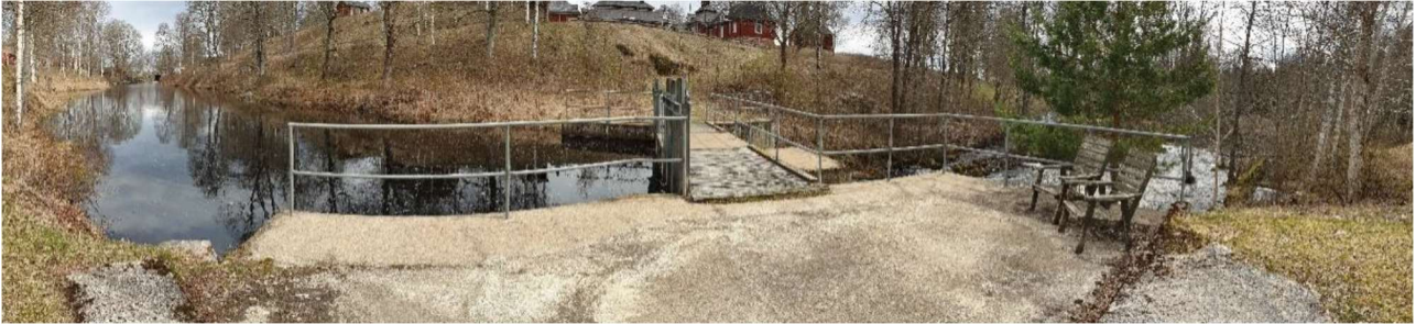
Figur 1 Malingsbo, nedre.

Målet är fria vandringsvägar för fisk i hela i hela övre Hedströmmen. För att gynna öring är återskapande av strömsträckor av högsta prioritet vilket betyder att möjligheten till avsänkning av dammen behöver utredas.