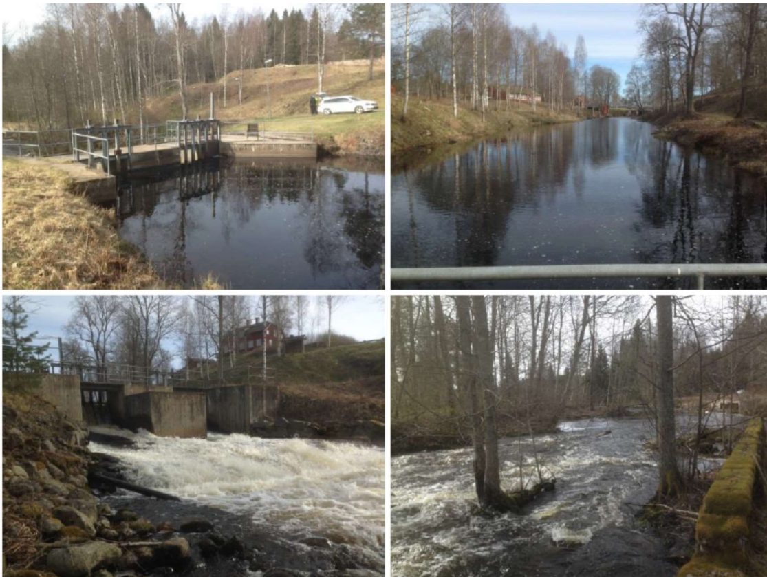
Figur 3. Malingsbo, nedre.