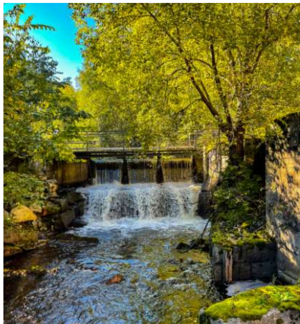
Figur 2 Hyttedammen vid Lienshyttan

Målet är fria vandringsvägar för fisk i hela vattenförekomsten. Borttagna dammar ger fria vandringsvägar för fisk och biotopvårdsinsatser kan förbättra möjligheter för öring och flodpärlmussla och förbättra habitatet för andra strömvattenberoende arter.