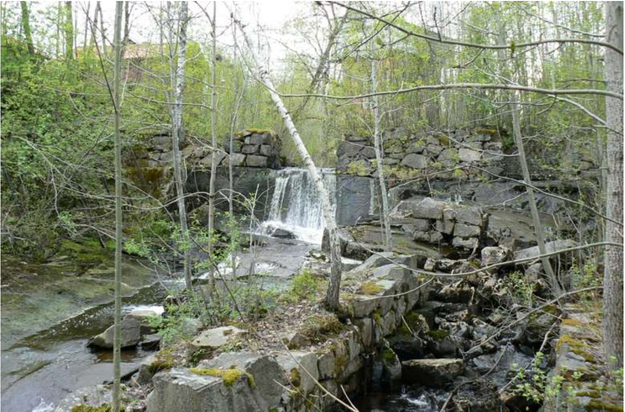
Figur 3 Damm nedströms Hyttdammen