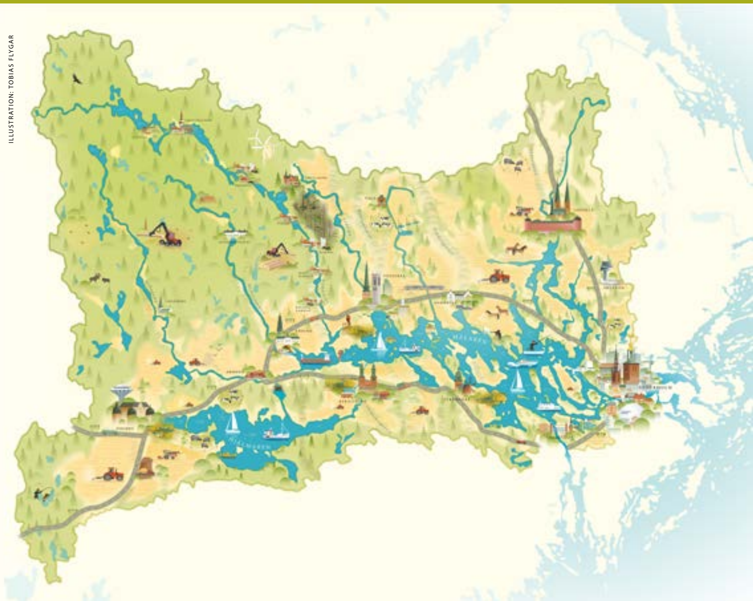
ILLUSTRATION: TOBIAS FLYGAR

Vision för Mälarens vattenvårdsförbunds verksamhet 2022-2027