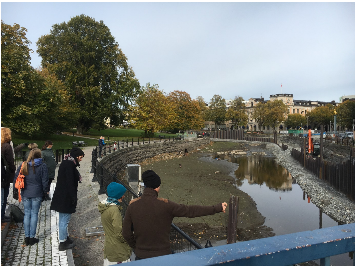
Bygge av faunapassage i Svartån, ett delprojekt inom LIFE IP Rich Waters