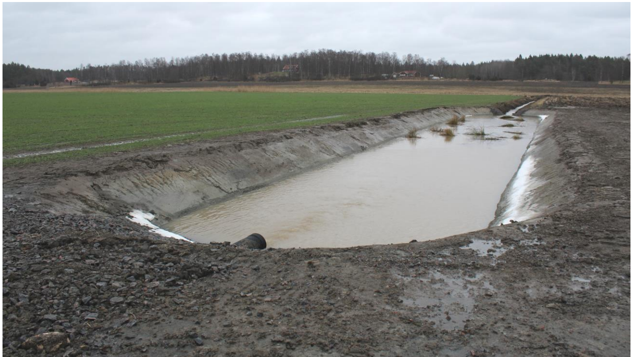
Fosfordamm vid Skämsta, Västerås kommun som finansierats av SÅP-bidrag via MER.