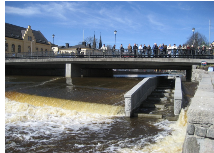
Fisktrappa i Fyrisån i Uppsala

Eskilstuna kommun har anslagit 15 miljoner som ett första steg att öppna upp vandringsvägarna för fisk och fauna. Arbete pågår ..