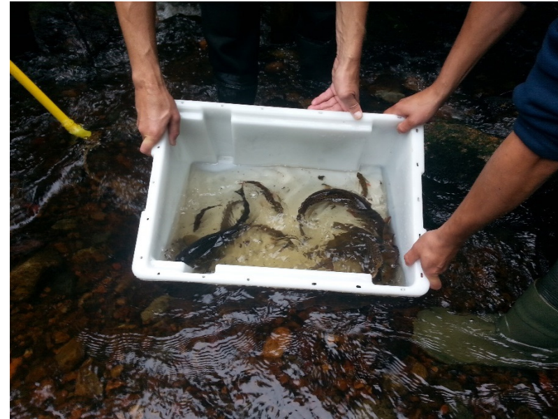
Öring i Skinnskatteberg.