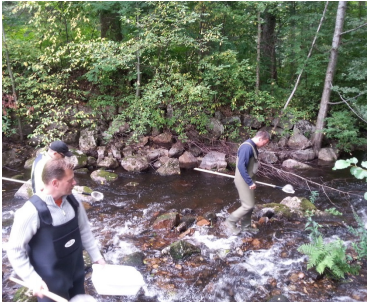
Utbildning i akvatisk ekologi, SLU Skinnskatteberg.

Vi jobbar med att minska påverkan på biologisk mångfald i vattendrag där vi har verksamhet.