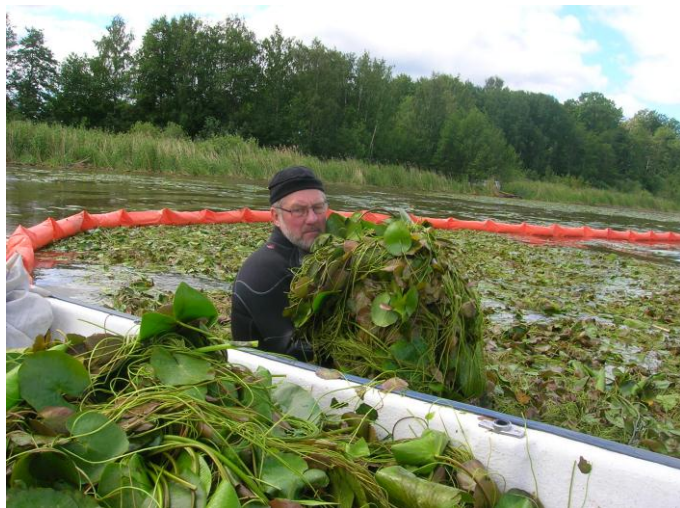
Figur 1. Bekämpning av sjögull i Galten, Kungsörs kommun.

Resultaten av projektet redovisas i en skriftlig rapport som finns på vattenvårdsförbundets hemsida ( länk ). Det är svårt och arbetsintensivt att bekämpa sjögull (figur 1) och arten sprider sig relativt snabbt i Mälarens västra del Galten.